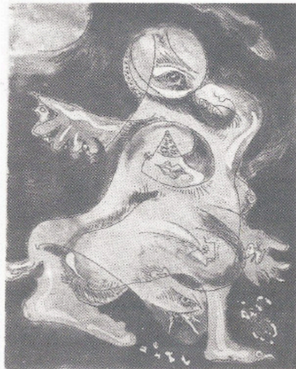
LUNATICAS (1974) - Aguatinta y Color ANDRÉ MASSON

MUSEO PROV. DE BELLAS ARTES EMILIO CARAFFA CORDOBA - ARGENTINA